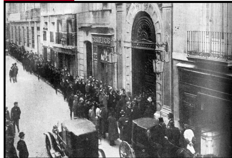
Fachada del Ateneo de Madrid, 1920

de la fundación del Ateneo Científico, Literario y Artístico de Madrid 1835-2010