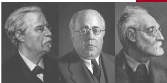
Cánovas del Castillo, Manuel Azaña, Miguel de Unamuno, presidentes del Ateneo de Madrid.

El 31 de octubre de 1835 la Real Sociedad Económica Matritense de Amigos del País convocó una reunión al objeto de estudiar el restablecimiento del Ateneo Español suprimido en 1823, y de la que salió la propuesta de crear un nuevo Ateneo Científico, Literario y Artístico de Madrid.